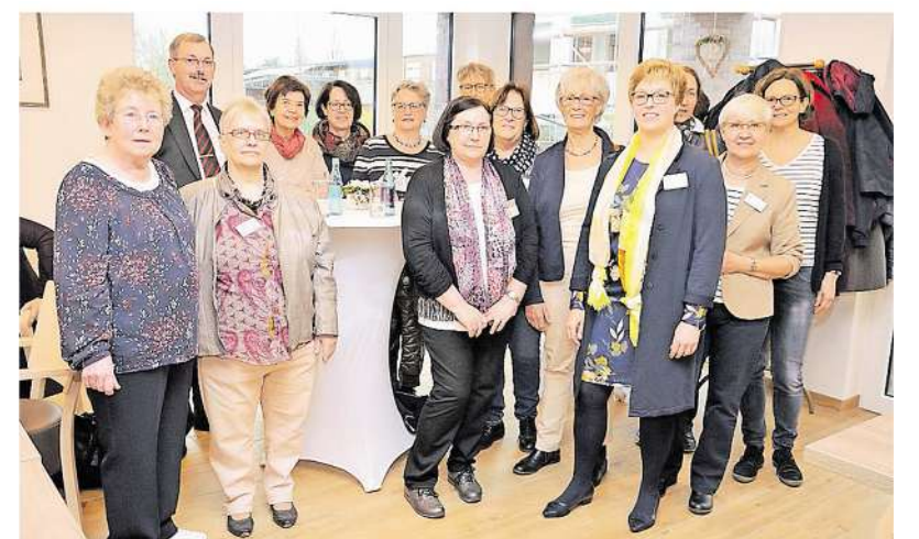
Das Team der Hospizbewegung Camino ist mit seinem Büro in das Sozialzentrum Bauchem umgezogen und hatte zur Einweihungsfeier geladen.

Camino feiert am kommenden Sonntag, 31. März, ab 17 Uhr mit einem Benefizkonzert zugunsten von Camino in der Kapelle des Loherhofs weiter. Der Chor Ars Cantata wird auftreten. Der Erlös kommt der Hospizarbeit zugute.