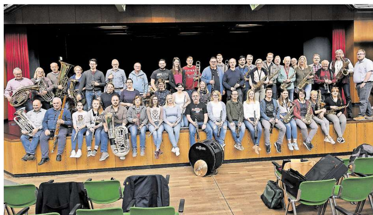
Leger, aber nicht ungeordnet gingen die Damen und Herren der Privat-Musikkapelle Scherpenseel ihr Probenwochenende vor dem Frühjahrskonzert an.